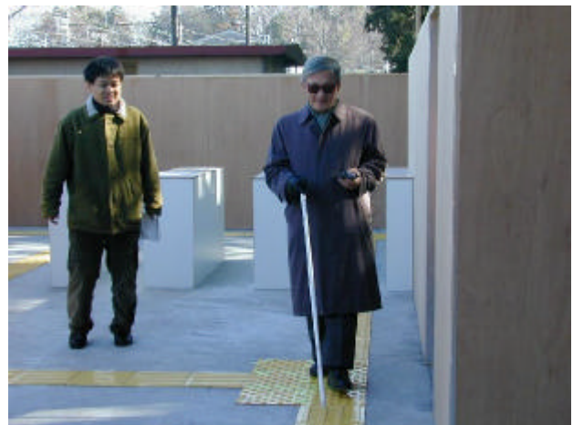
図3 システムを利用している様子

を押して目的地を音声で入力すると、歩く途中で「右に曲がって3m進んでください」という案内があり、その指示に従って歩くと目的地まで誘導される。誘導案内中、進む道順を誤っても、「ルートが違います。反転してください。」といった案内がされる。周りの雑音などで聞き逃した場合は「もう一度」と入力することにより、直前の案内文を繰り返す。電池の残量が残り少なくなっていた場合には、携帯端末側から案内がなされる。個人情報の設定で、男性/女性の登録をしておくと、男性用/女性用の制限のある施設(例えばトイレなど)に暗黙的に案内を行う。