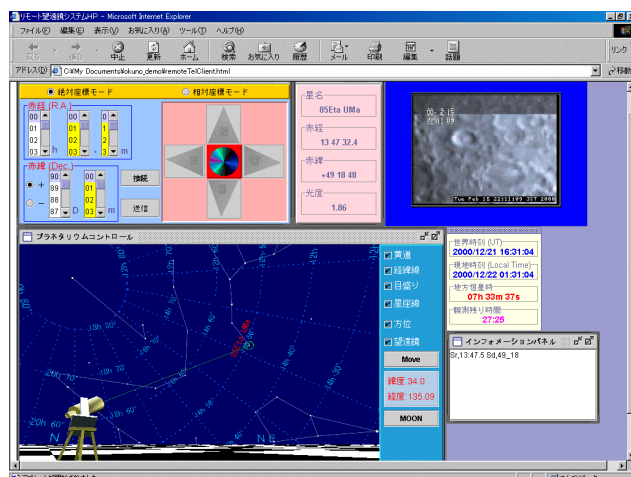
図 1 リモート望遠鏡の GUI