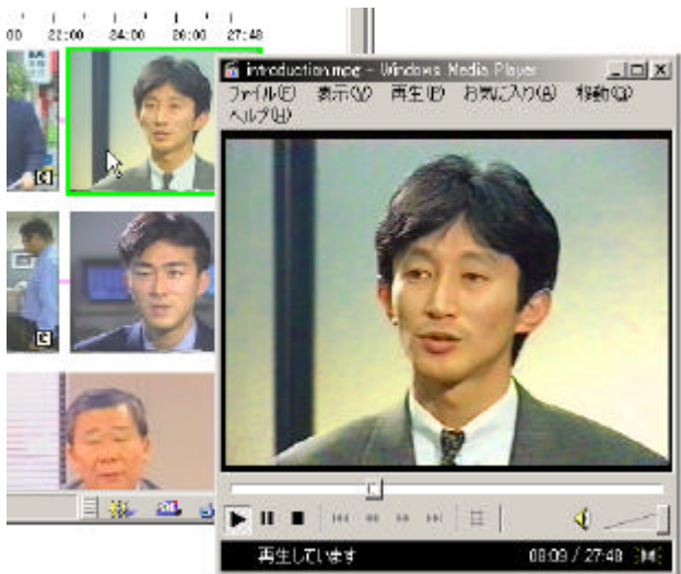
図 4: キーフレームからのビデオ再生

ロックで表示される。キーフレーム右下隅の四角枠に C の記号はそこに文字情報が埋め込まれていることを表し、ポインタをそのフレーム上に動かすと文字情報が吹き出し状の枠中に表示される。この文字情報には、例えばビデオ音声の書起し、脚本、視聴者のメモ等様々なものが考えられる。図 3 の例では、ビデオ音声から書起したテキストを [5] 記載の手法により区表現要約したものを使用した。このインターフェースは2ボタンマウスによる操作を想定しており、キーフレームを左ボタンでクリックすると図4のように該当する箇所からビデオが再生される。また、右ボタンでクリックすると要約表示で省略