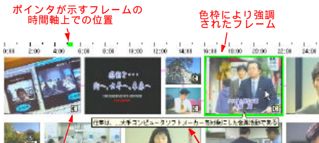
図 3: インターフェースの各要素