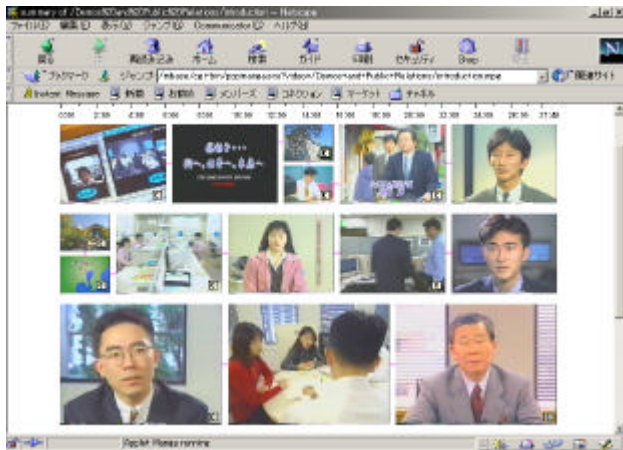
図 2: ブラウザ上で表示したビデオ要約