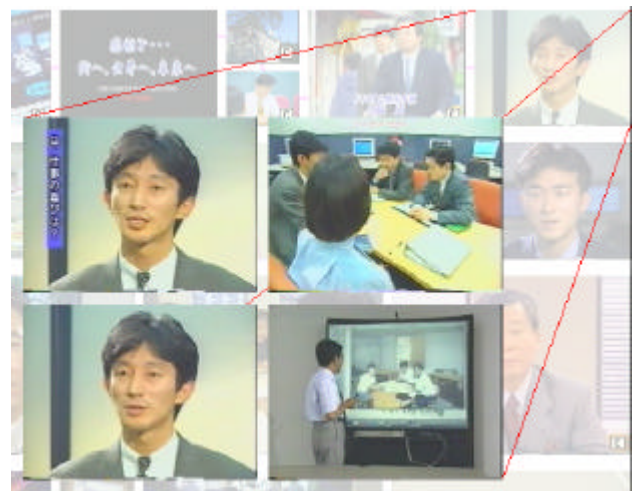
図 5: 詳細を表示させた例

ロックで表示される。キーフレーム右下隅の四角枠に C の記号はそこに文字情報が埋め込まれていることを表し、ポインタをそのフレーム上に動かすと文字情報が吹き出し状の枠中に表示される。この文字情報には、例えばビデオ音声の書起し、脚本、視聴者のメモ等様々なものが考えられる。図 3 の例では、ビデオ音声から書起したテキストを [5] 記載の手法により区表現要約したものを使用した。このインターフェースは2ボタンマウスによる操作を想定しており、キーフレームを左ボタンでクリックすると図4のように該当する箇所からビデオが再生される。また、右ボタンでクリックすると要約表示で省略