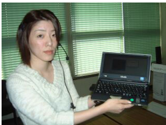
図 1 システム利用イメージ

本研究では映像・ナレッジ・Bluetooth 技術を融合し、MPEG4 映像・音声・テキストからなるマルチモーダル・ナレッジを、ユビキタス環境で Bluetooth 機器に配信するシステム MKIDS (Multimodal Knowledge and Information on Demand Service) over Bluetooth を開発した。このシステムは、マルチモーダル・ナレッジを、コンテンツサーバから Bluetooth アクセスポイントを経由して、個人が所有する PDA などの Bluetooth 機器に配信できる世界初のシステムである。