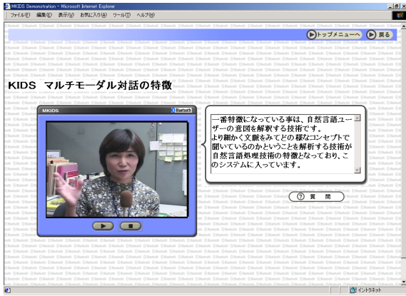
図 3 MKIDS クライアント画面