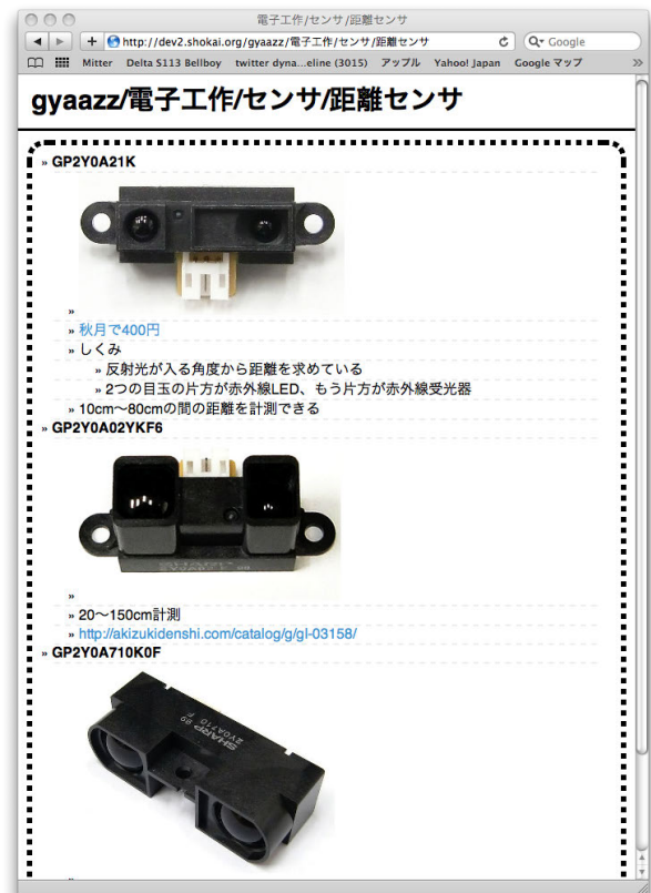
図 2 ウェブアプリケーション gyaazz Fig.2 gyaazz : outline editor web application

ウェブブラウザ上では gyaazz というアウトラインエディタが表示される。(図:2) gyaazz は gyazz 2) を参考にして実装されたウェブアプリケーションである。マウスでダブルクリックした行を画面遷移する事無くその場で編集でき、[と]の記号のみを用いたマークアップで簡潔に画像やリンクなどを挿入できる。emacs 風のキーボードショートカット機能を持ち、アウトラインエディタとしてのブロック単位の編集が容易になるようにデザインされている。複数のユーザが同時に1つのページを編集した場合も、編集内容は自動的に同期される。アウトラインエディタを使用する事で、ユーザは行毎に簡潔で、インデント毎に内容が入れ子となった表現を強制される。ユーザはこの gyaazz 上