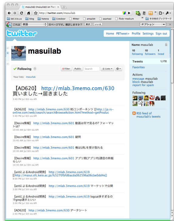
図 4 twitter 上での gyazz-checker Fig. 4 gyaazz-checker on twitter

ストレンゲージはタニタ社製キッチンスケール KD-189 を分解して取得した。オペアンプ AD620BNZ で差動増幅回路を組み、その出力を Arduino 1) の 10bitAD コンバータで計測する。AD620BNZ のゲイン設定用抵抗には温度係数の小さい巻線抵抗を使用する事で、気温の変化による誤差を小さくする事ができた。計測値を USB ケーブルでパソコンに送信し、パソコン上の Ruby スクリプトで 100 回分の平均と値の標準偏差を取得する。パソコン上のプログラムは、初回起動時に 10 グラム、20 グラム、30 グラムの重さの分銅を