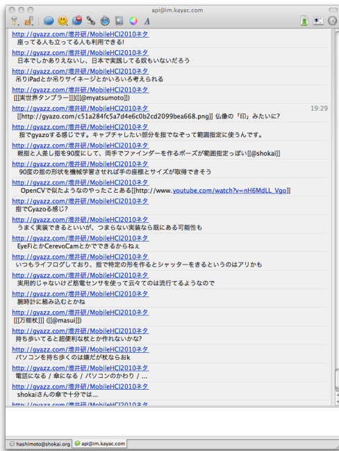
図 3 google talk 上での gyazz-checker Fig. 3 gyaazz-checker on google talk

バーはそれぞれ twitter 上で 300 から 2000 人を follow している。メンバーが煩わしさを感せず、gyaazz 上の更新の盛り上がり、twitter 上でも感じられる様に調整した結果、1 ページ毎に 1 行から 3 行を 10 分毎に twitter に通知する事にした。