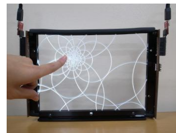
図2 AcrySense利用時のイメージ

を確認した。そこで彫刻部との接触をAcrySenseへの入力操作とし、AcrySenseはこの光量の変化を元におおまかな指の接触位置を推定する。シンプルかつ安価な構成とするため、光源としてLEDを、光量の検出センサとしてフォトダイオード（以下、PD）を利用する。