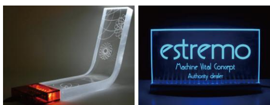
図1 照明付きアクリル彫刻の例

近年、レーザー加工機などの普及に伴い、アクリル板の表面に彫刻をほどこした作品作り（アクリル彫刻）が身近になりつつある。こうしたアクリル彫刻は、液晶バックライトのように側面から光を投射することで彫刻模様が浮かび上がり、美しく魅せることができる。こうした照明付きアクリル彫刻はアート作品としてだけでなく、表札・広告など幅広く利用されている（図1）。我々は、このアクリル彫刻をインタラクティブな入力装置として扱うことを可能にするシステム「AcrySense」を提案する。