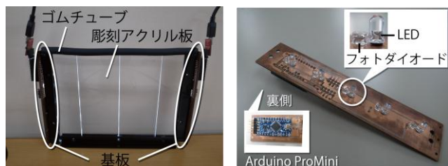
図4 プロトタイプの外観と構成

アクリル彫刻は、大きさ150mm×212mm、厚さ5mmの透明アクリル板を利用した。今回利用するLEDとPDの直径が5mmであったため、アクリル彫刻と基板を固定しやすいよう、厚さ5mmのアクリル板を利用した。アクリル板上部の側面は、遮光のため切断したゴムチューブを被せている。