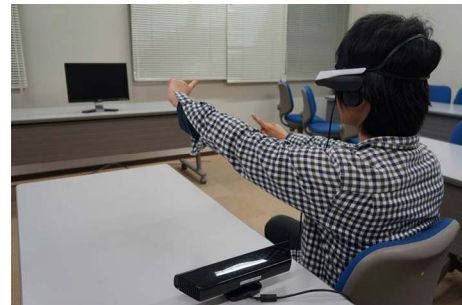
図1 プロトタイプシステムを利用するユーザ Fig. 1 A user who uses a prototype.

識するための入力画像取得のために Kinect [2] を用いた。Kinect を用いて取得した画像を計算機に送り、重畳表示処理を行い、ヘッドマウントディスプレイに提示する。図1にプロトタイプシステムを利用する様子を示す。