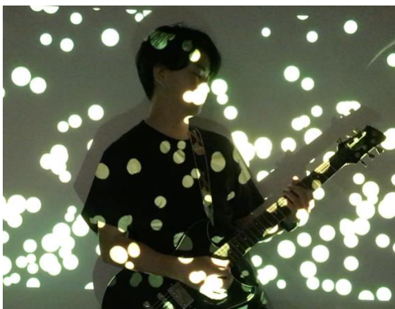
図 3 本インターフェースによるパフォーマンス

また、長い入力フレーズでは、文字数が長いコマンドが出力される傾向があることがわかった。発話フレーズにより意図通りにコマンドが実行されないことがあった。この問題に関しては、コマンドが十分にアプリケーションの機能を説明できていないことが考えられる。しかしながら、即興演奏においては「テンポを速くして」との発話に対し、「テンポを遅く」というコマンドが誤って選択されることがあった。これは、テンポという単語に対する類似度が正しく評価された一方で、速さに関する意図理解が正しくされなかったと考えられる。しかし、誤った操作がなされたにもかかわらず、意外なギターフレーズが生まれて好印象になる場合もあった。また、今回は大語彙連続音声認識および、word2vec モデルは、学習済みモデルを使ったため、音楽・映像アプリケーションのパラメータに使われるような専門的な単語を全てカバーできていないという問題があった。そのため、専門的な単語を適応させるなどを検討する必要がある。