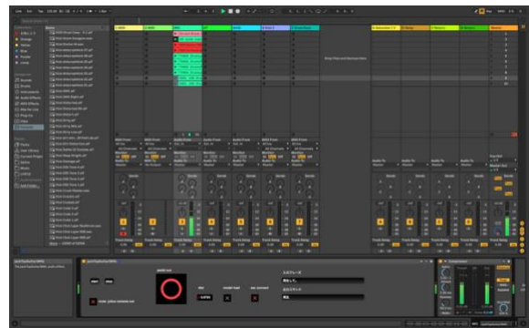
図 4 音楽アプリケーションの様子。下部画面に開発した Max for Live デバイスを挿入している。