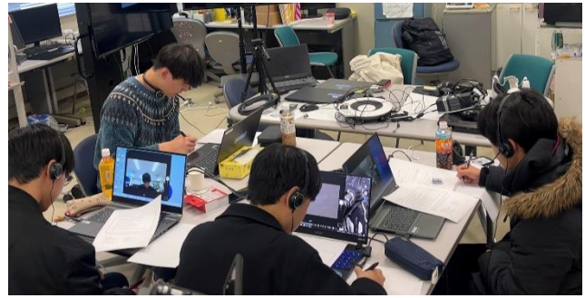
図 4 実験の様子

フィードバック・アドバイスの内容は評価結果のフィードバックに加え,3.4(トレーニング内容)を元にアドバイスを伝える.その後 1 週間の期間を置いたのちに再度実験を行ってもらう.2 回目のコンセンサスゲームのお題として「NASA ゲーム」というものを行った.1 回目との大きな差異は場面が砂漠ではなく月面にいることとアイテムの種類が違う事だけである.また,同意書を用いて実験協力者の同意を得た上で実験を行った.