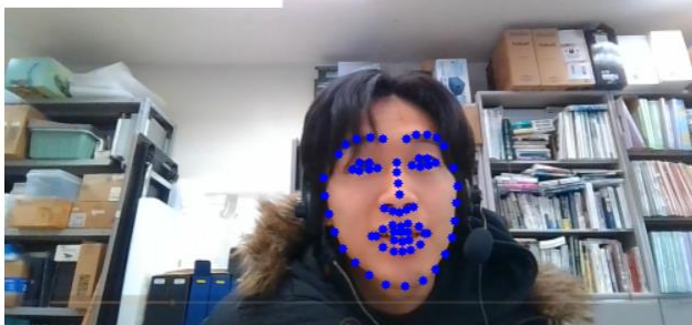
図 2 視線推定の様子