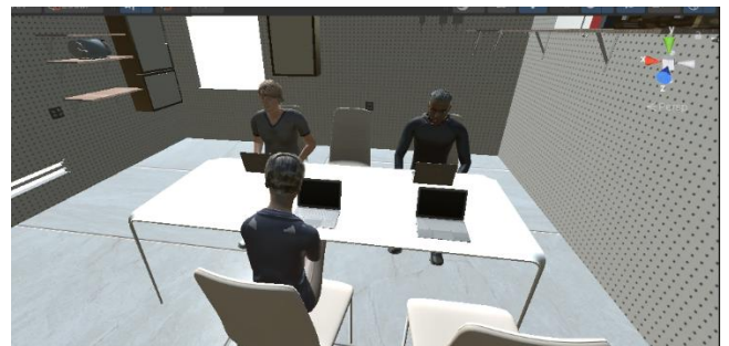
図 3 トレーニング VR 空間

トレーニングを行う際、3.2 で定義した評価項目すべてに関して行ってしまうと、意識すべき点が増え、混乱することで逆効果になってしまう可能性があると考えられる。より効果的にトレーニングを行うために、評価の悪かった項目に重点を置いたシステムをそれぞれ、計 3 つ用意することにした。また、トレーニングの内容はそれぞれ異なるが、使用する VR 空間や人物は同じものを使う。現状でのトレーニングシステム VR 空間を図 3 に示す。