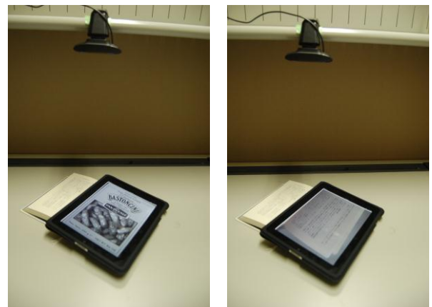
図4 実行結果 (左: 取込前, 右: 取込後)

図 4 に端末を書類に重ねて取り込んだ時の結果を示す。図 4 左のようにマーカが表示されている状態で端末を重ね、画面をタッチすると、数秒で取り込みが完了する。その後、図 4 右のように画面に書類の内容が表示され、持ち運ぶことができる。取り込んだ書類の画質は十分で、文章の内容を把握することができた。