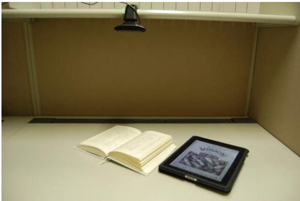
図3 システムの写真