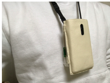
図 4 プロトタイプの装着例