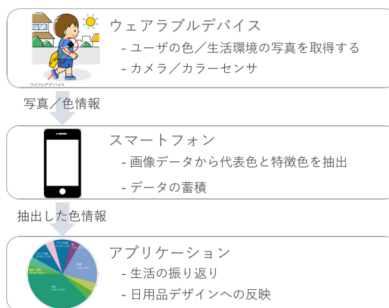
図 2 システム構成図 Fig. 2 System Configuration

色を取得するウェアラブルデバイスは、生活環境を記録するためのカメラと、ユーザ自身の色を記録するためのカラーセンサを備える。ユーザは体の一部にデバイスを身につけて生活し、一定時間ごとに生活環境の写真と自身の色情報を取得する。スマートフォンでは、撮影した写真から代表色と特徴色を抽出し、ユーザ自身の色や時刻情報と併せてデータを蓄積する。アプリケーションでは、色を用いた生活の振り返りや、色を日用品デザインに反映させることを考えている。まずは記録した色情報を閲覧する振り返りシステムをスマートフォンアプリで構築した後、日用品等での活用に発展させる。