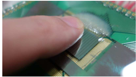
図4 触覚呈示の様子