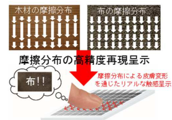
図 1 触覚ディスプレイの概要

に変化する電圧を印加することで、凹凸感のような触感を使用者に呈示できる。静電吸着による摩擦振動触覚ディスプレイは多くの報告があるが、構成要素である電極は単一のものが殆どである [3]。また、円状の電極を 3 mm の間隔で配置した摩擦振動触覚ディスプレイを製作した例もあるが、摩擦振動で点字を使用者に呈示するものであった[4]。本研究では、図 1 に示すように、この摩擦振動触覚ディスプレイの構成要素の電極を微細加工技術によって従来よりも小さい 1 mm の大きさまで微小化し、アレイ化する。そして、個々の電極への印加電圧を制御することで指と触覚ディスプレイとの間に働く静電吸着力を局所的に制御する。