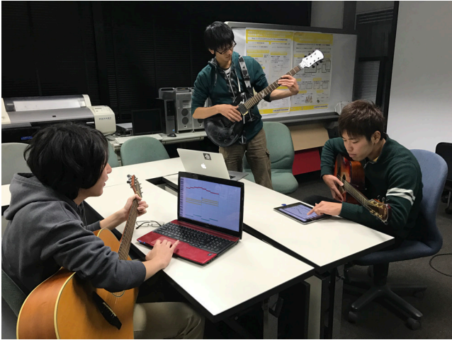
図 1 本システムを使用している様子 Fig. 1 Use Case.