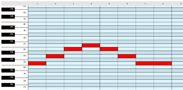
図 2 ピアノロールインターフェース Fig. 2 Piano Roll Interface.