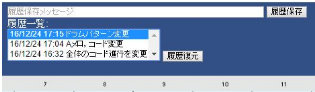
図 5 履歴機能のユーザーインターフェース Fig. 5 User Interface of History Function.