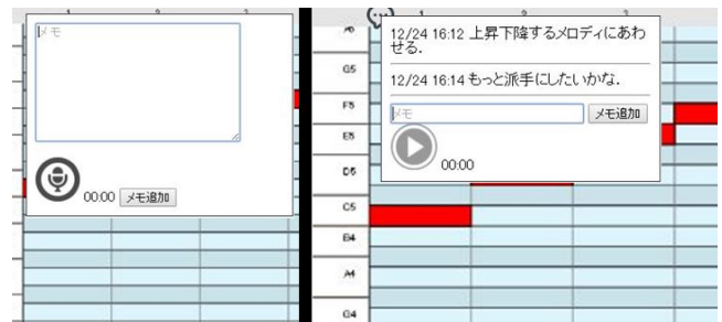
図 4 メモの入力及び表示 Fig. 4 Input Form and Annotation Style.

せるようになった。タッチデバイスを用いる場合は、マウスポインタがないため、楽譜上の一点を長押しすることで、ポインタを表示させるようにした。こちらのポインタもユーザごとのノーツの色に合わせた。タッチデバイスでも、この機能を用いることで容易に指示対象を示すことができるようになった。